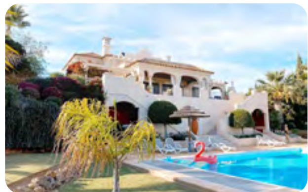
✔ Met zon