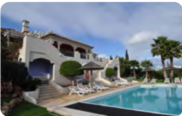
✘ Zonder zon

Dus fotografeer altijd met het licht mee en altijd met de gordijnen open.